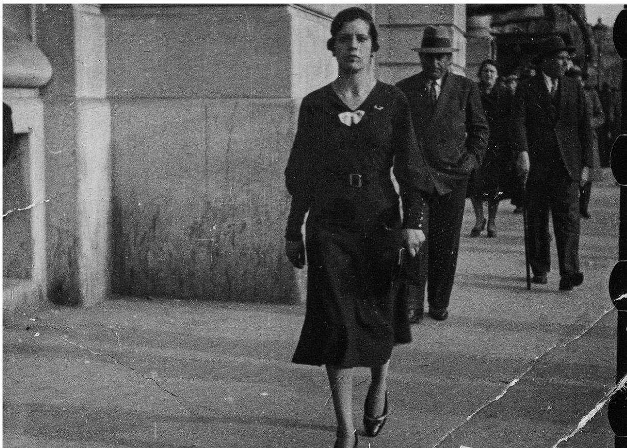
Laía Argüelles Folch. La flâneuse (detalle), 2021. Libro de artista